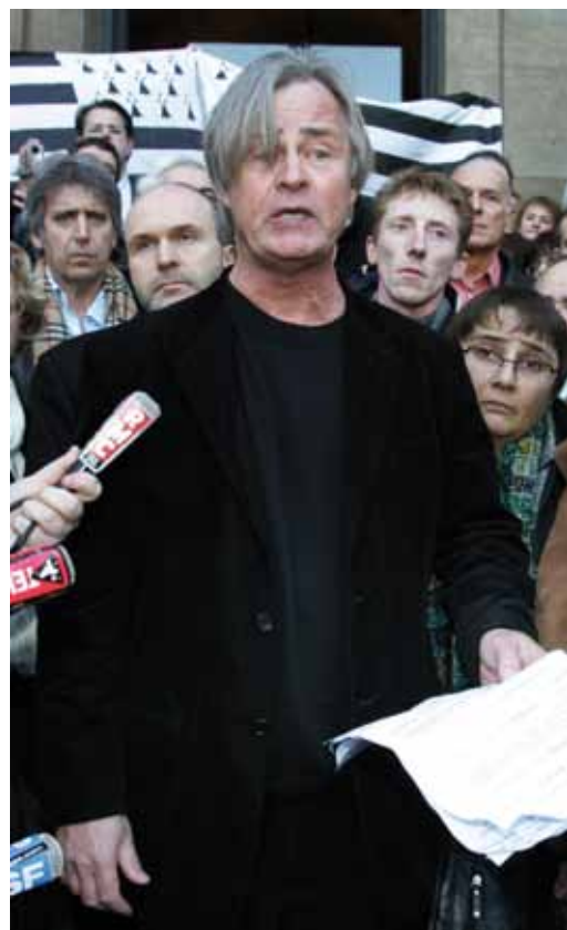
A la sortie du Palais de justice de Paris le 14 décembre 2006.